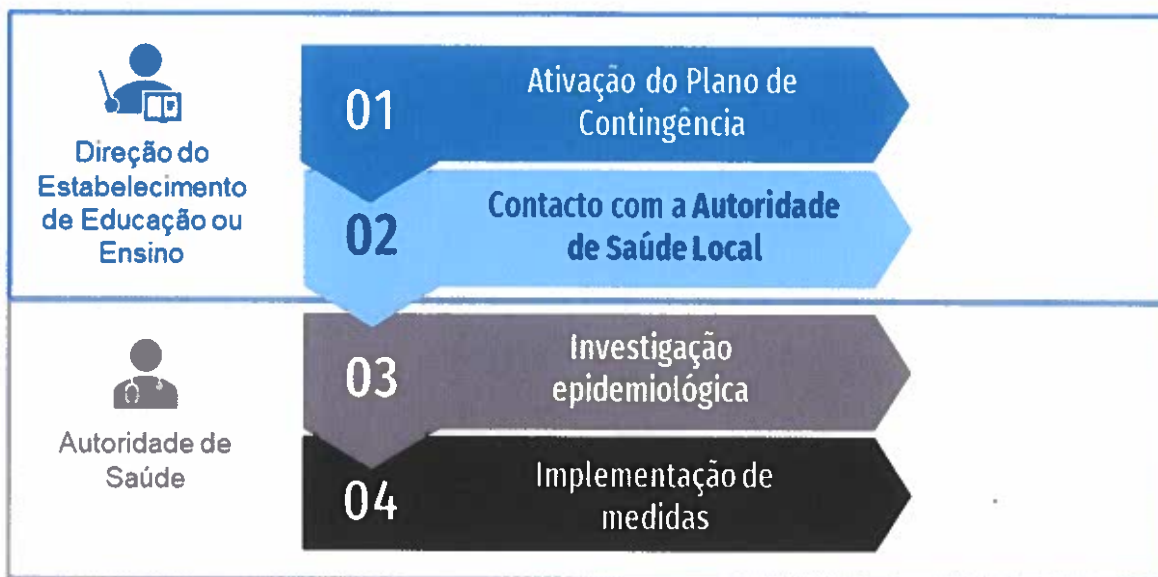
Figura 2. Fluxograma de atuação perante um caso confirmado de COVID-19 em contexto escolar